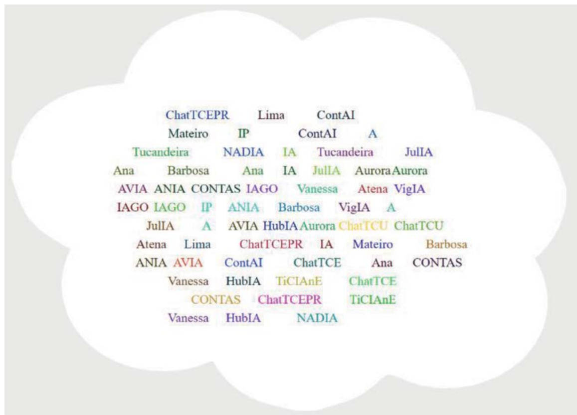
Figura 1 - Soluções de IA nos Tribunais de Contas do Brasil

Essa tabela evidencia a evolução dos projetos de IA nos Tribunais de Contas de 2023 a 2024, demonstrando um progresso significativo em várias áreas-chave. A transição de projetos iniciais para iniciativas mais avançadas e integradas reflete um amadurecimento na utilização da IA, com os tribunais começando a perceber benefícios tangíveis em termos de eficiência, eficácia e suporte à decisão. Esses avanços destacam a importância de continuar investindo em infraestrutura e parcerias, garantindo que os projetos de IA sejam sustentáveis e contribuam de forma significativa para os objetivos estratégicos dos tribunais.